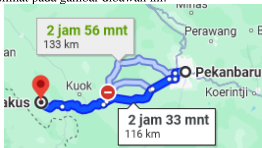
Gambar 8: Maps Candi Muara Takus

Berdasarkan hasil penelitian tentang atribut akses di Candi Muara Takus dinilai cukup baik. Dinilai cukup baik, karena sesuai dengan fakta yang ditemukan bahwa kondisi Akses menuju Candi Muara Takus cukup jauh dari Kota Pekanbaru, dimana jarak tempuh dari Kota Pekanbaru ke Candi Muara Takus memakan waktu sekitar 2 sampai 3 jam. Hal ini dapat dilihat pada gambar dibawah ini: