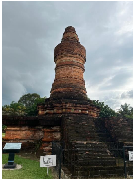
Gambar 11: Candi Mahligai

Dapat dilihat gambar dibawah ini informasi tentang Candi Mahligai yang ada di Candi Muara Takus: