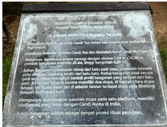
Gambar 14: Informasi Candi Bungsu