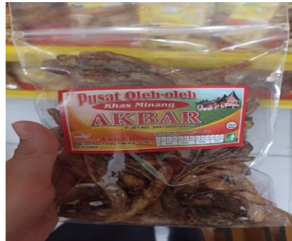
Gambar 3. Salai Pisang

pasar. Kepemilikan izin PIRT menunjukkan bahwa produk tersebut telah memenuhi standar keamanan dan kualitas yang ditetapkan oleh otoritas, sehingga memberikan jaminan keamanan kepada konsumen. Dengan adanya izin ini, produk salai pisang dapat dipasarkan lebih luas dan diterima baik oleh konsumen, mencerminkan komitmen penjual terhadap regulasi pemerintah dan kepercayaan konsumen.