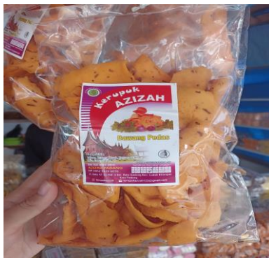
Gambar 6. Kerupuk bawang pedas

Ditemukan bahwa 83,3%, 70%, dan 73,3% produk oleh-oleh makanan tradisional tidak memiliki informasi produk pada kemasannya, sementara 26,7%, 16,7%, dan 30% produk ditemukan memiliki informasi produk pada kemasannya. Dari hasil tersebut, 26,7% produk memuat informasi merek, 16,7% memuat komposisi bahan, 30% mencantumkan kode produksi, 30% mencantumkan tanggal kedaluwarsa, 26,7% mencantumkan alamat produksi, dan tidak ada produk (0%) yang mencantumkan cara penyimpanan serta berat bersih pada kemasannya.