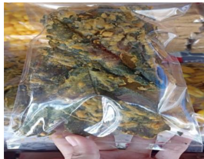
Gambar 4. Keripik Bayam

Hasil penelitian menunjukkan bahwa semua produk, termasuk keripik bayam pada kode data 03, tidak mencantumkan izin BPOM pada kemasannya. Padahal, izin BPOM adalah syarat wajib untuk legalitas produk makanan, sebagaimana diungkapkan oleh Darmawan (2021), yang menyatakan bahwa izin ini menjamin kualitas bahan, bebas dari zat berbahaya, dan kebersihan produk. Tanpa izin BPOM, konsumen tidak mendapatkan jaminan keamanan, yang dapat mempengaruhi kepercayaan mereka terhadap produk.