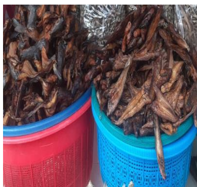
Gambar 7. Ikan salai asap

Data menunjukkan bahwa produk kerupuk bawang pedas dengan kode 21 sudah mencantumkan beberapa informasi produk, termasuk merek/nama produk, komposisi bahan, dan alamat produksi. Namun, penjual belum memiliki izin BPOM dan belum mencantumkan informasi yang jelas mengenai kode dan tanggal produksi, tanggal kedaluwarsa, cara penyimpanan, serta berat bersih setiap kemasan produk yang dijual. Penulisan informasi produk pada kemasan sangat penting untuk memudahkan konsumen dalam memperoleh informasi mengenai makanan yang mereka konsumsi.