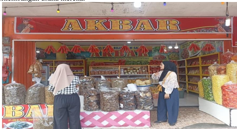
Gambar 2. Salah satu toko oleh-oleh Ombilin Danau Singkarak

Badan Pengawas Obat dan Makanan (BPOM) berperan dalam memastikan kualitas dan keamanan produk makanan yang beredar di pasaran. Produk yang telah terdaftar di BPOM dijamin aman untuk dikonsumsi sesuai dengan ketentuan yang berlaku. Legalitas ini tidak hanya melindungi konsumen tetapi juga meningkatkan kepercayaan terhadap produk-produk yang dijual, terutama dalam pasar yang semakin kompetitif. UMKM sering kali mengabaikan pentingnya legalitas usaha, padahal hal ini sangat penting untuk bisa bersaing di pasaran. Di daerah Ombilin, tepian Danau Singkarak, misalnya, banyak pelaku UMKM yang memproduksi oleh-oleh kuliner khas seperti olahan ikan bilih, namun belum semua memenuhi persyaratan legalitas. Edukasi kepada masyarakat setempat mengenai pentingnya legalitas usaha sangat diperlukan untuk mendukung keberlangsungan dan perkembangan usaha mereka.