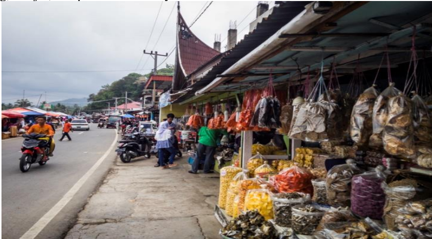
Gambar 1. Pusat Perbelanjaan oleh-oleh Ombilin Danau Singkarak

oleh-oleh, dan souvenir. Kawasan ini juga menjadi tempat persinggahan wisatawan yang berbelanja kebutuhan sehari-hari atau menikmati kuliner khas seperti ikan bilih olahan. Pasar ini dilengkapi dengan fasilitas seperti pasar oleh-oleh, tambak ikan, dermaga, warung, masjid, dan pemukiman masyarakat.