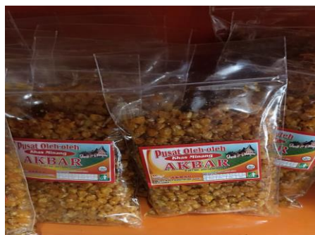
Gambar 5. Jagung Goreng

Penelitian menunjukkan bahwa hanya 23% produk yang memiliki sertifikat halal, sementara 73,3% lainnya tidak mencantulkannya. Contohnya, produk jagung goreng pada data 04 sudah memiliki sertifikat halal. Sertifikat halal penting untuk memastikan bahwa bahan dan proses pengolahan makanan bebas dari unsur yang tidak halal, seperti alkohol atau babi. Darmawan (2021) menekankan perlunya kajian khusus untuk memastikan kehalalan produk, mengingat pencampuran bahan halal dan haram yang bisa terjadi. Di Indonesia, dengan mayoritas penduduk Muslim, produsen seharusnya memenuhi hak perlindungan konsumen terkait kehalalan produk.